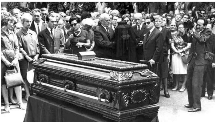
Сахрана Вељка Петровића у Београду, 29. јула 1967. године

српским писцима и сликарима, објављених у првој нашој (Станојевићевој) енциклопедији, и са Миланом Кашанином ко-аутор темељног дела „Српска уметност у Војводини од доба деспота до уједињења“, обновитељ српске родољубиве поезије, како га је назвао Јован Скерлић, и најизразитији приповедач равничарских мотива, рођен је 23. јануара 1884. г. у Сомбору, као син свештеника Светођурђевске цркве и препарандијског катихете Ђорђа Петровића. Вељкова мати Милева била је кћер све-