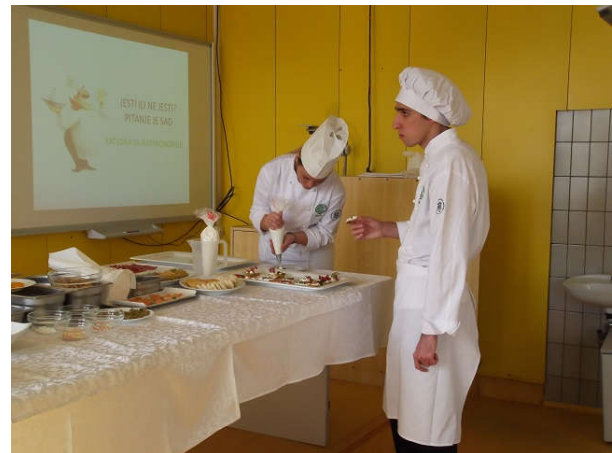
Slika 1- Gastronomske poslastice pripremljene od strane studenata, odseka za gastronomiju

U 11.30h, kada je završeno takmičenje, učenici su imali priređen koktel koji je trajao do 12h, kada su usledila predavanja. Dok su profesori fakulteta pregledali testove, koji su bili sastavljeni iz teoretskog dela koji je nosio 60 bodova i neme karte koja je nosila 40 bodova, dotle su naši učenici prisusvovali predavanju profesora sa Departmana za geografiju, turizam i hotelijerstvo.