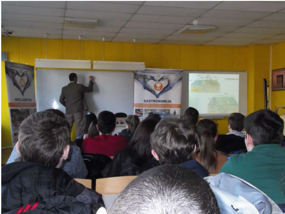
Slika 2- Presentacija pomeranja litosfernih ploča, koje kao produkt imaju vulkanološku aktivnost na Zemlji

Drugo predavanje je bilo na temu „Kretanja Zemlje kroz kosmos“, kao i korišćenje Geografskih informacionih sistema koji se koriste u različitim privrednim delatnostima (poljoprivreda, šumarstvo, zdravstvo, komunalne delatnosti, uprava i administracija i dr.).