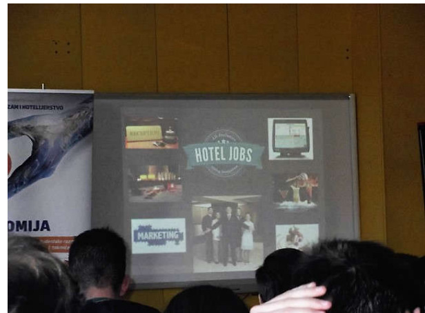
Slika 3 i 4- Presentacija kretanja Zemlje kroz Kosmos, kao i značaj satelita u sadašnjici kao i prezentacija hotelskog smeštaja u Velikoj Britaniji

Četvrto predavanje bilo je na temu „Klime gradova“, kako se dobijaju odgovarajući klimatski elementi, kada se u toku dana vrše merenja, kao i na temu Geoekologije i kako zagađenje i uticaj čoveka generalno utiču na menjanje klime za Zemlji.