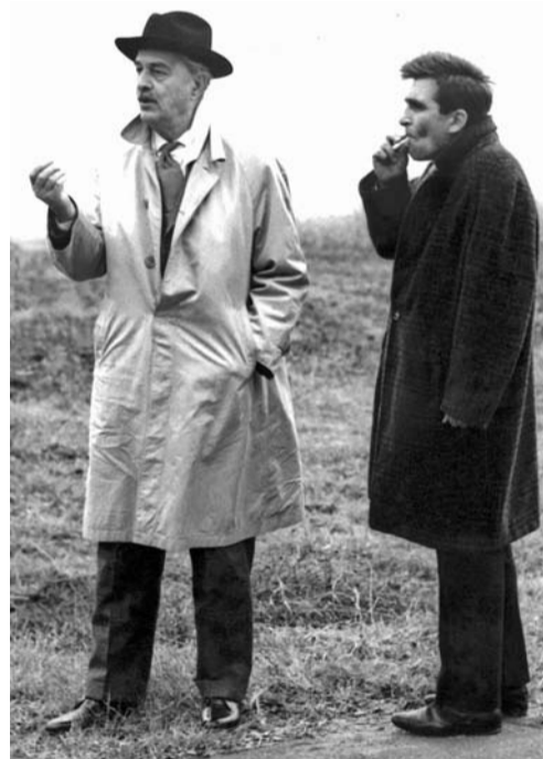
Са Миком Антићем, на снимању филма „Тројица из старог Сомбора“, почетком 1967. године

везаности за земљу и завичај, Вељко Петровић је уткао Сомбор и Сомборце у своје приповедачко дело у истој мери као што их је Милан Коњовић уткао сликарском четкицом по својим платнима.