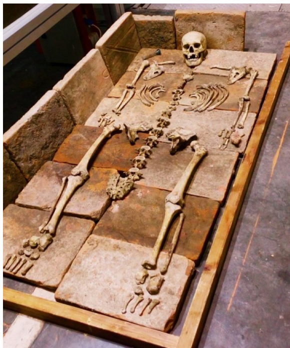
Римски скелет. *

Међу најпосећенијим поставкама су биле оне археолошких и историјских друштава и секција. За најмлађе посетиоце је била осмишљена демонстрација ископавања и изучавања скелета из времена Римског царства, док је засебно постављен модел гробнице скелета из истог периода. Историчари су показали како компјутерске симулације представљају будућност музеја, па су наши ученици имали прилику да пођу у један виртуелни обилазак, као и да уз помоћ VR (Virtual Reality) наочара „прошетају“ кроз средњовековну цркву. Волонтери су били спремни да помогну и пруже одговоре на свако постављено питање.